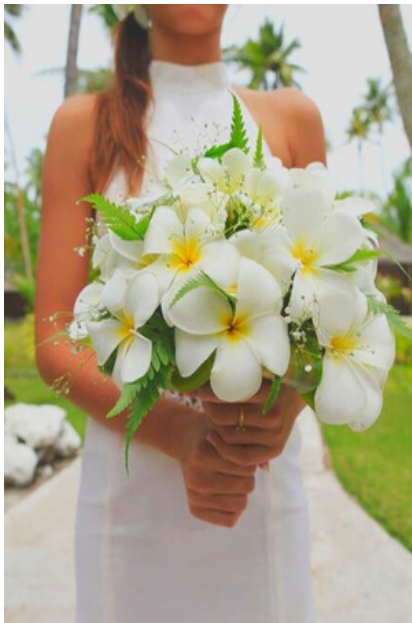
Bouquet Rond Frangipaniers