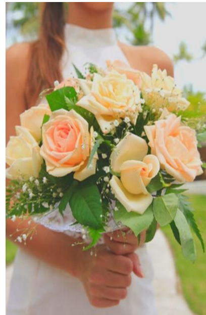
Bouquet de Roses Rond