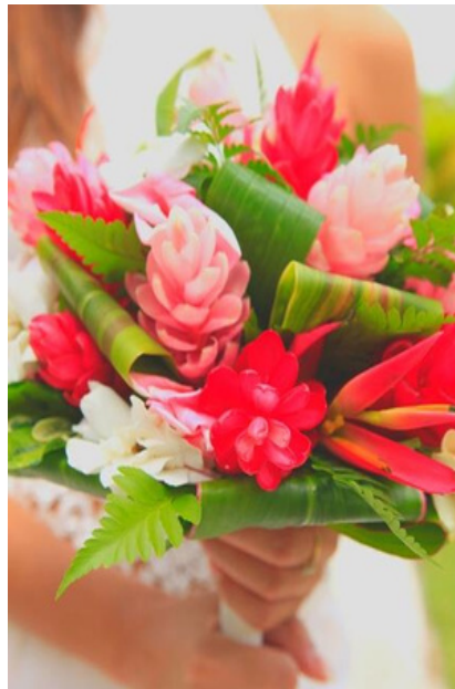
Bouquet Rond Exotique