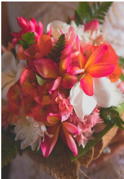
Bouquet Rond Deluxe