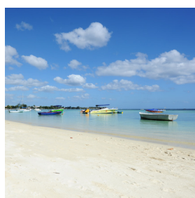
Plage de Trou aux Biches (100 m)

Cette nouvelle résidence d'apparts hôtel se situe à seulement 30 minutes de la capitale, Port-Louis, à 15 minutes de Grand-Baie et à environ une heure de l'aéroport.