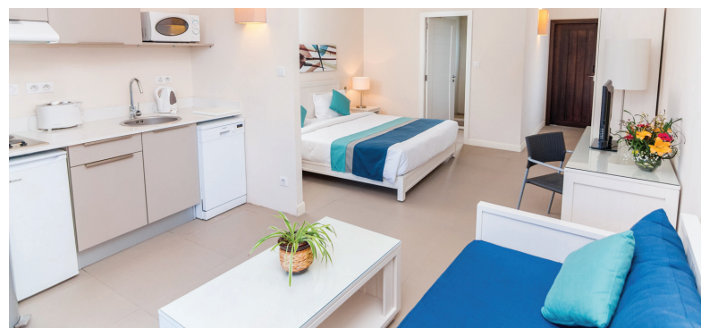
Be Cosy - Studio

(78-107 m 2 ) 1 chambre, 1 chambre en mezzanine, séjour, kitchenette et balcon / terrasse (max 5 pers)